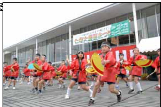
オープニングは仁保小5・6年による御

来年の農業まつりも盛大に行いたいと思いますので、ご意見・ご提案等ありましたら、仁保大農業まつり実行委員会事務局(交流センター : 929-0125)までご連絡ください。